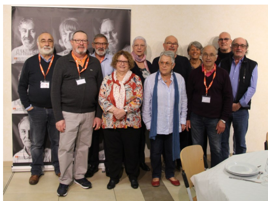
Délégation de l'UTR de la Gironde

Ce 2ème congrès s'est déroulé à Périgueux le 12 et 13 avril 2022. Cette mandature, avec la fusion des régions Aquitaine, Limousin, Poitou Charentes a montré la disparité entre les tailles des départements .