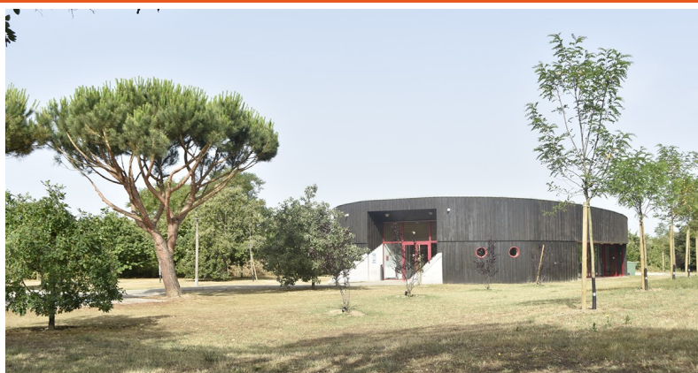
Salle d'Eysines au Pinsan (salle festive)