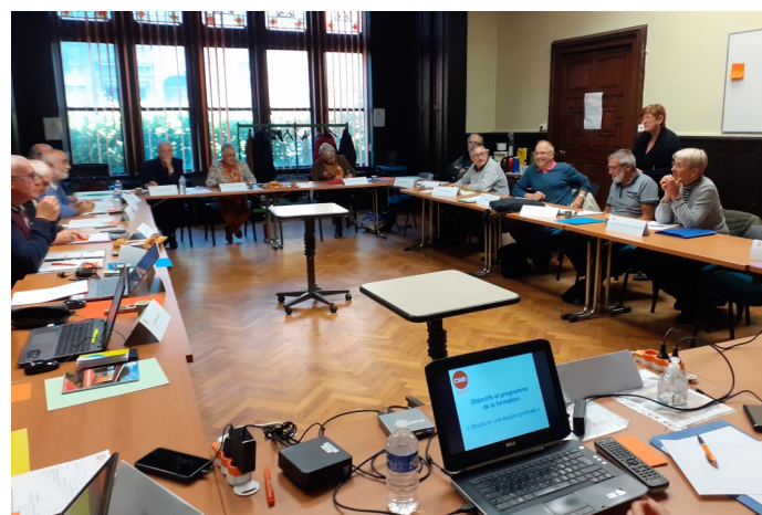
Formation structurer une équipe

Les priorités de l'UTR étaient de former ses responsables. Le conseil a suivi la formation « structurer une équipe ». Et des membres indisponibles à ces dates ont bénéficié d'une journée spécifique.